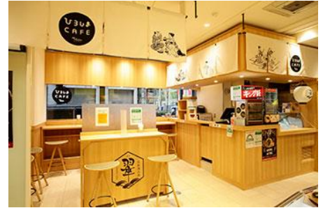
1階ひろしまカフェ