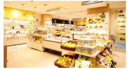
1階ショッピングフロア