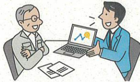
ボトルネックを発見

専門家が貴社を訪問し、生産工程におけるムリ・ムダ・ムラの把握およびボトルネック分析を実施。