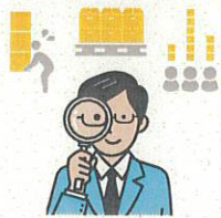
ムリ・ムダ・ムラを分析